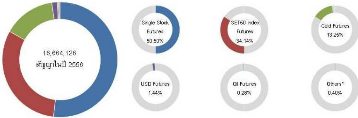
กราฟแสดงสัดส่วนปริมาณการซื้อขายสินค้าในตลาดสัญญาซื้อขายล่วงหน้า

ส่วน Gold Futures พบว่ามีการซื้อขายทั้งสิ้น 2,206,031 สัญญา หรือคิดเป็นสัดส่วนเท่ากับร้อยละ 13.25 ของการซื้อขายทั้งตลาด และ SET50 Options, USD Futures, Silver Futures และ Sector Futures มีการซื้อขายรวมกันทั้ง 4 ประเภทคิดเป็นสัดส่วนร้อยละ 2.11 ของการซื้อขายทั้งหมด